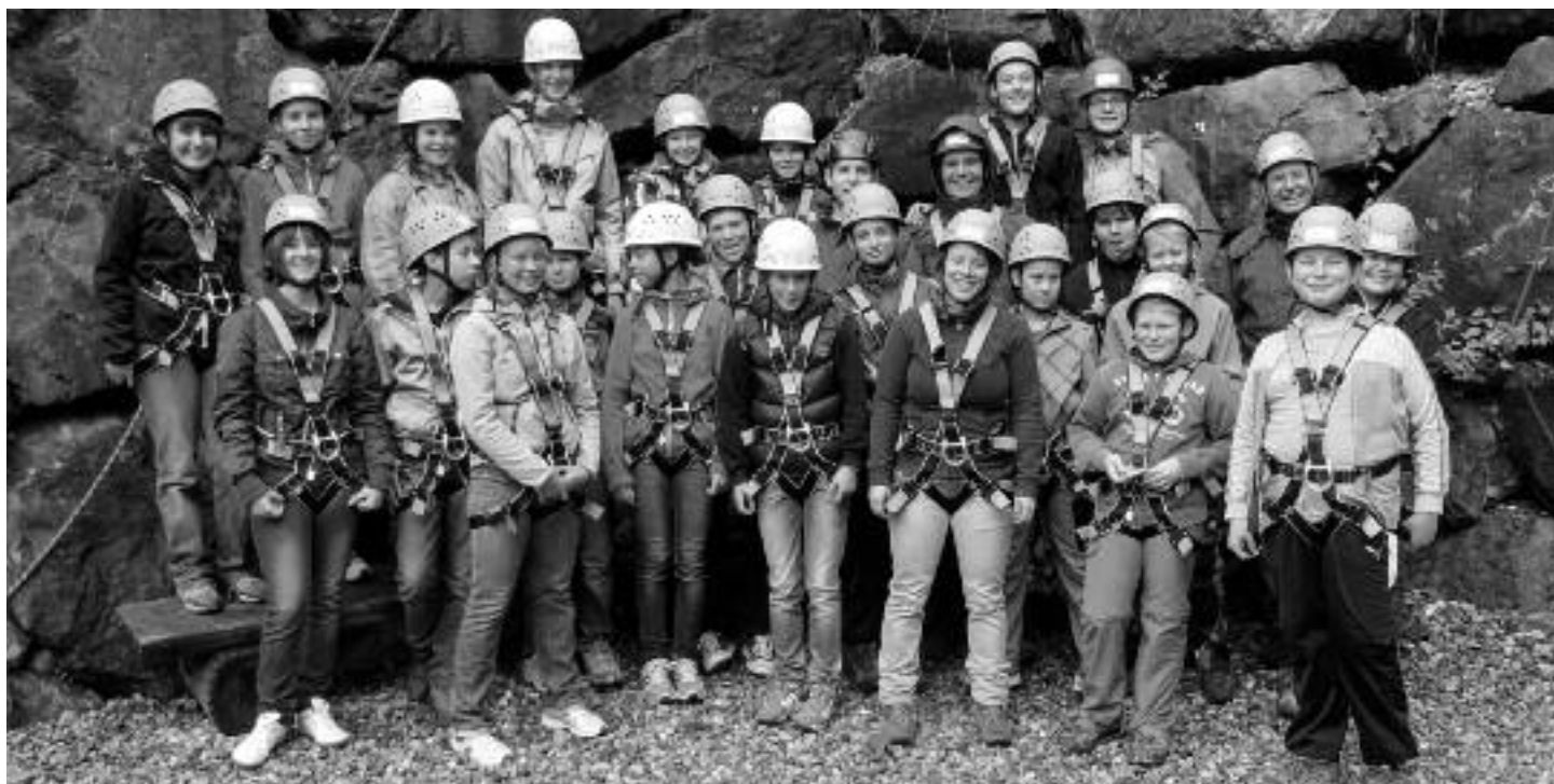
14. September 2013: Fachgerecht angesichert und guter Dinge harren Konfirmandinnen und Konfirmanden mit ihren Betreuern auf das Wagnis namens »Vertrauen« im Hochseilgarten des Deutschen Alpenvereins in Bad Hindelang.

Wir freuen uns, dass wir am Sonntag, 13. Oktober dieser Grundüberzeugung in ei-